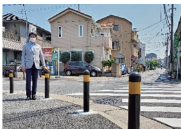
渡田小学校入口交差点の通学路上に車止めポールを設置しました。

また、対策必要箇所の対応については、見守り人材の配置や児童への安全教育などのソフト面の対策や、路面標示の設置等のハード面の対策を行うなど、関係機関と協議しながら、児童の安全確保に向けた取組を進めていきます。